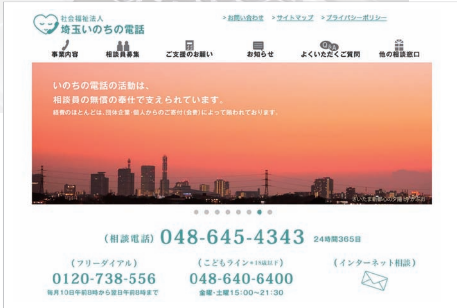
<ホームページ画面>

埼玉いのちの電話の活動紹介や催し物などのお知らせの他、年3回発行の広報誌を毎月掲載しています。また読み物のページなども充実をはかっています。どうぞ「埼玉いのちの電話」のホームページを開いてご覧下さい。 [ http://www.saitama-id.or.jp/index.html ]