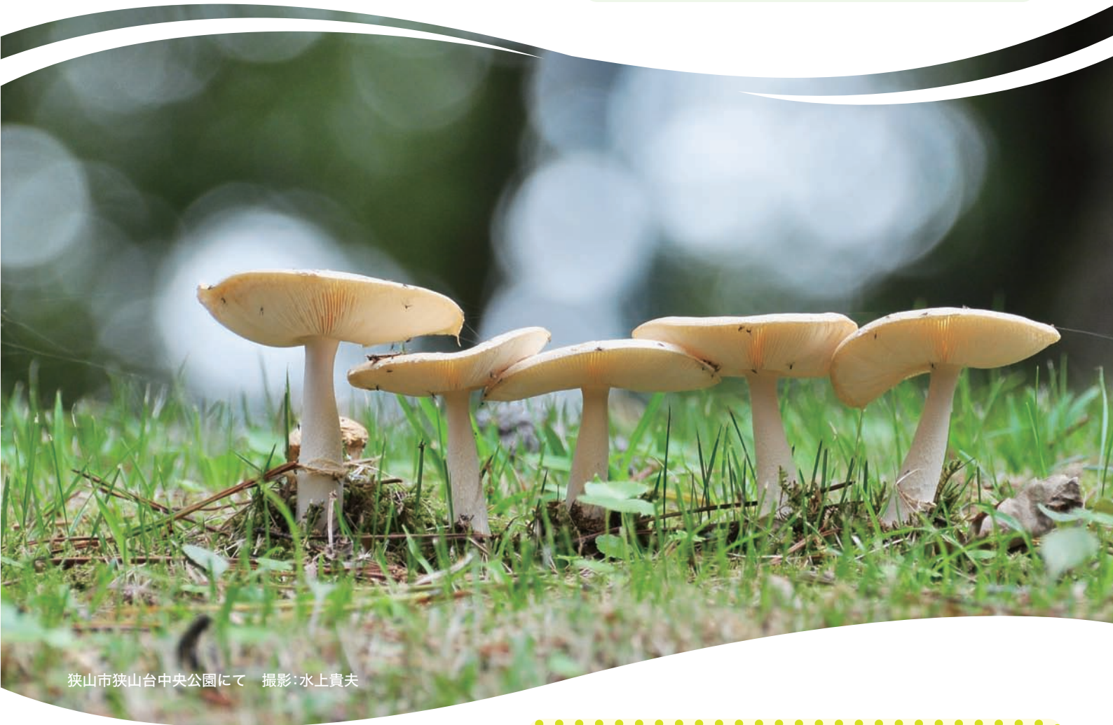
狭山市狭山台中央公園にて