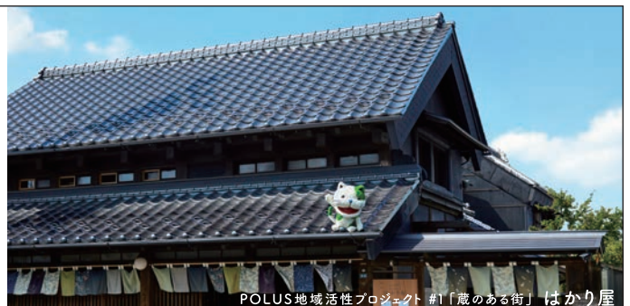
POLUS地域活性プロジェクト #1「蔵のある街」はかり屋