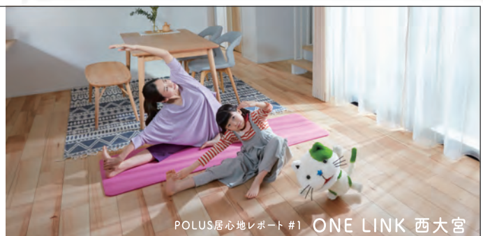
POLUS居心地レポート #1 ONE LINK 西大宮